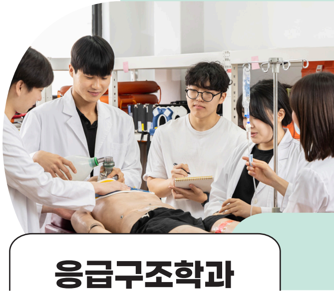
무단 복제·배포·인용·변경 시 법적 책임을 지고 있습니다.